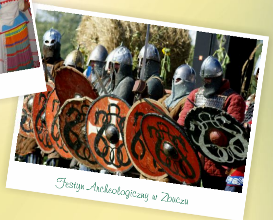
Festyn Archeologiczny w Zbuczu