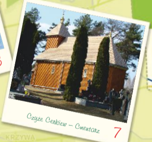
Czyże Cerkiew - Cmentarz 7