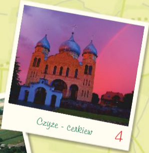
Czyże - Cerkiew 4