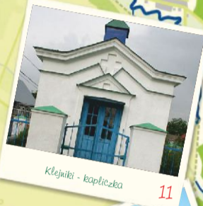
Klejniki - kapliczka 11