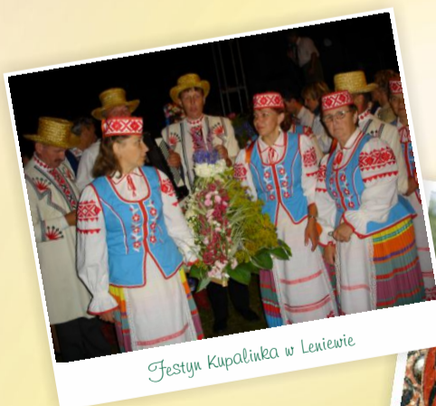
Festyn Kupaliński w Leniewie