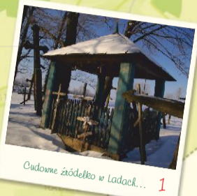
Cudowne źródełko w Ładach... 1