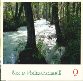
las w Podrzeczach 9