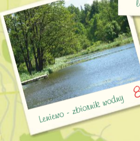
Leniewo - zbiornik wodny 8