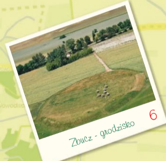
Zbucz - grodzisko 6