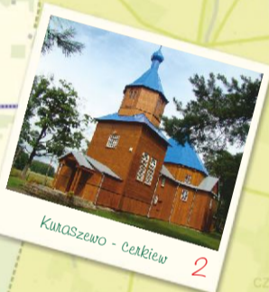
Kuraszewo - Cerkiew 2